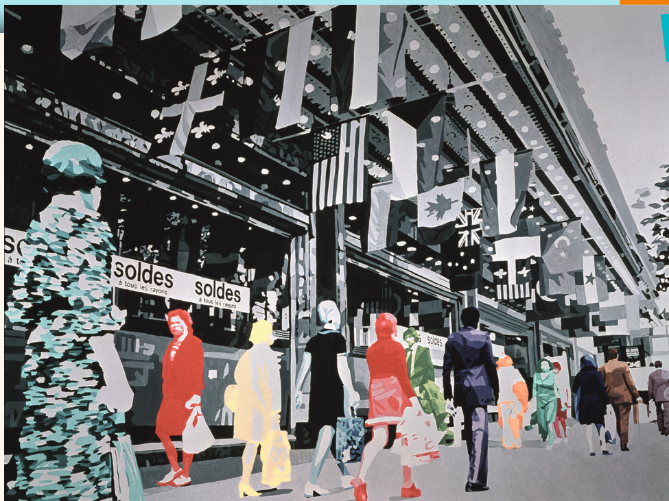
Gérard Fromanger (né en 1939), Au Printemps ou La Vie à l'endroit , 1972, huile sur toile, 150 x 200 cm, coll. privée.